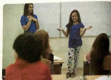
Declamação de poema.

Fonte: OLIVEIRA, Tatiana Amaral; ARAÚJO, Lucy Aparecida Melo. Tecendo Linguagem . 5 o ed. São Paulo: IBEP, 2018, p. 61.