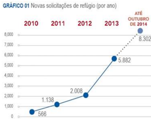
Gráfico 1 – Novas solicitações de refúgio (por ano)

Análises estatísticas trazidas pelo ACNUR no Brasil mostram o aumento significativo em números dessa situação, entre o período de 2010 a 2014 (ACNUR, 2014, p.1), conforme o gráfico 1: