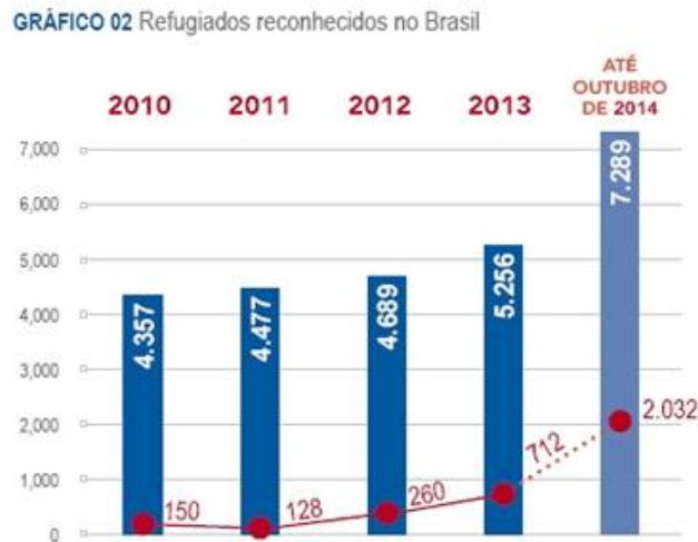
Gráfico 2 – Refugiados reconhecidos no Brasil