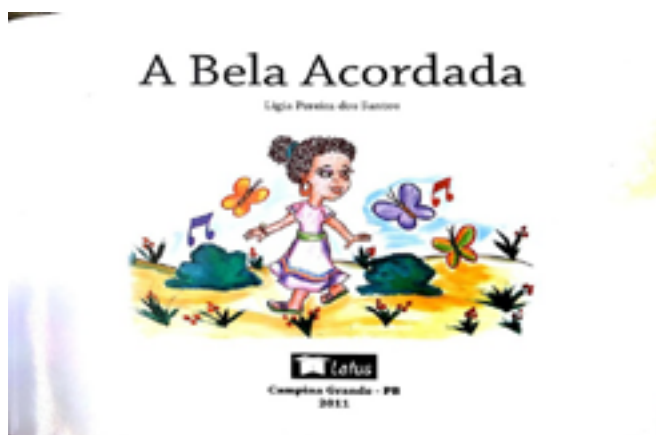
FIGURA 1 – Literatura Brasileira “A Bela Acordada”

Fonte do Livro: Autora: Santos, L P dos,( 2011)