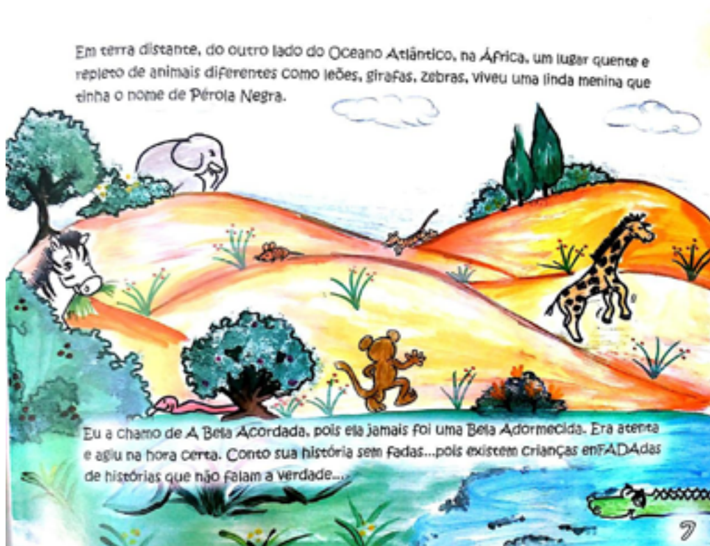
FIGURA 2 – Literatura Brasileira “A Bela Acordada” p.7

Fonte do Livro: Autora: Santos, L P dos, ( 2011)