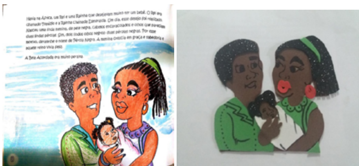
FIGURA 3 – Adaptação “A Bela Acordada”p.8

Fonte Autora: Paiva, L L M (2019) Adaptação experimental em braille, tinta ampliada e figuras representativas táteis – esboços provisórios.