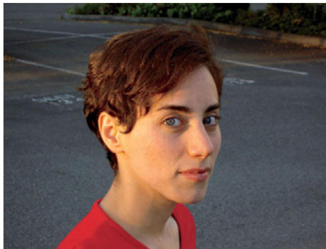
Figura16 - Maryam Mirzakhani

Maryam, la única mujer ganadora de una Medalla Fields (máximo galardón que puede obtener un matemático en la actualidad, siendo de hecho equivalente al Premio Nobel no existente en Matemáticas) hasta el presente, fue galardonada con esta distinción el día 13 de agosto de 2014, en Seúl, año en el que ella era becaria de investigación en el Instituto Clay de Matemáticas y profesora de la Universidad de Princeton. El Jurado le concedió ese galardón a atención a las siguientes razones: “Por sus contribuciones sobresalientes a la dinámica y la geometría de las superficies de Riemann y sus espacios modulares” .