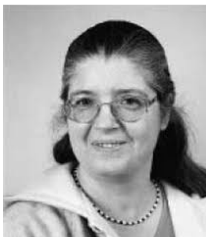
Figura 8 - Bernadette Perrin-Riou

Bernadette se graduó en 1977 y se doctoró en la Universidad de París-Sud XI en Orsay en 1983 con una Tesis sobre la “Aritmética de las curvas elípticas y la teoría de Iwasawa”.