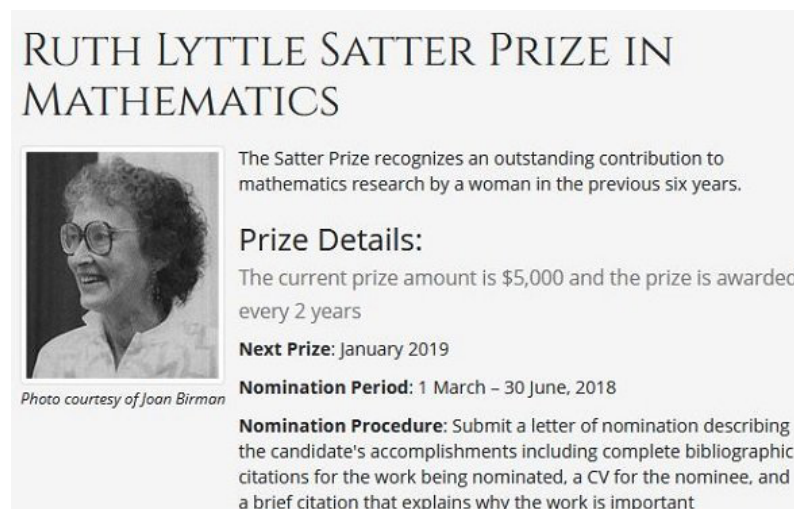
Figura 1 - Detalles del Premio Ruth Lyttle Satter

Fuente: https://www.google.es/search?q=premio+ruth+lyttle+satter+matematicas