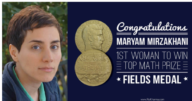
Figura 17 - Maryam Mirzakhani, ganadora de la Medalla Fields