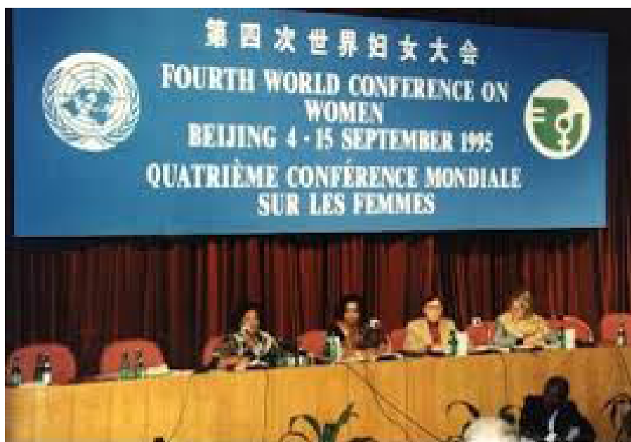
Figura 20 - Conferencia de Pekín