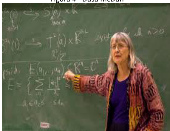
Figura 4 - Dusa McDuff

Dusa se licenció en Matemáticas en la Universidad de Edimburgo y obtuvo su doctorado en el Girton Collage, en Cambridge, en 1971. En 1975, ya separada de su primer marido, fue invitada para enseñar en la Universidad de Cork, pasando posteriormente al MIT y posteriormente al Instituto para Estudios Avanzados, volviendo después a Inglaterra, a la Universidad de Warwick, donde conoció a su segundo marido, el matemático John Milnor, medalla Fields y ganador de los Premios Wolf y Abel.