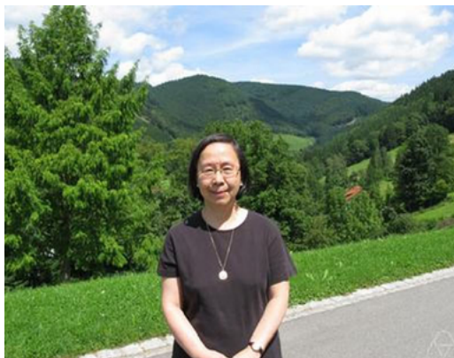
Figuras 6 y 7 - Sol-Yung Alice Chang (izquierda) e Ingrid Daubechie (derecha)