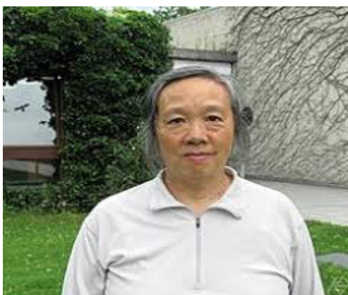
Figura 5- Lai-Sang Young

Actualmente, Lai-Sang es profesora del Courant Institute, en la Universidad de Nueva York.