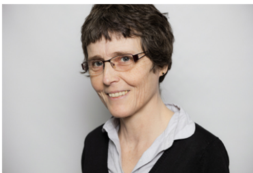
Figuras 13 y 14 - Claire Voisin (izquierda) y Laure Saint-Raymond (derecha)

Actualmente, Claire es profesora en el Collège de France, está casada y tiene 5 hijos.