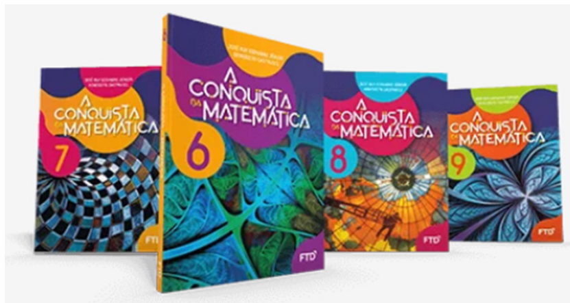
Figura I – coleção da FTD de 2018 aprovados pelo PNLD em 2020